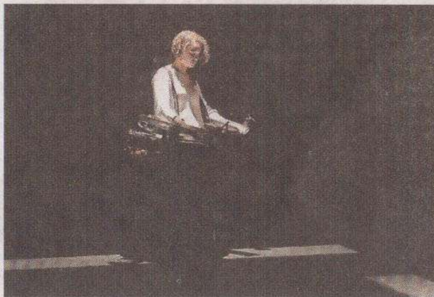
Double Compass reageert op onzichtbare muren en gangen en leidt zijn drager door de expositieruimte.

Double Compass reageert op onzichtbare muren en gangen en leidt zijn drager door de expositieruimte. Ook andere objecten, zoals de pilaar in het midden van de zaal, zorgen voor een impuls aan het lichaam. Compass komt in opstand als de drager weerstand biedt en zorgt daarmee voor een andere beleving van de ruimte. De ruimte is getransformeerd. Alleen met de instal-